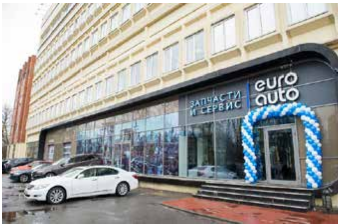
Рисунок 2-3: На территории торгового предприятия находится станция технического обслуживания, занимающаяся техническим обслуживанием автомобилей и ремонтом автомобилей; источник: EuroAuto

В большинстве городов России как мелкие, так и крупные предприятия по продаже аксессуаров (дополнительного оборудования) деталей и расходных материалов, нередко объединенных в одно крупное сетевое предприятие.