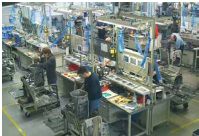
Рисунок 2-4: Российское специализированное предприятие по ремонту автоматических трансмиссий ZF = «Zahnradfabrik» = «Gear Factory» = «Фабрика передаточных механизмов» занимается только ремонтом автоматических коробок передач; источник: ZF

Специализированные сервисные предприятия, как правило, ограничивают оказываемые ими услуги ремонтом отдельных компонентов транспортных средств, или специализируются на установке и обслуживании одной...двух систем транспортного средства. Примером специализированного предприятия может служить такие хорошо известные сервисные предприятия, как Bosch Diesel Service = Дизельный сервис Бош, занятый обслуживанием дизельной аппаратуры автомобилей и автобусов; Московский Центр автоматических трансмиссий, занимающийся диагностикой и ремонтом автоматических коробок передач различных типов и производителей.