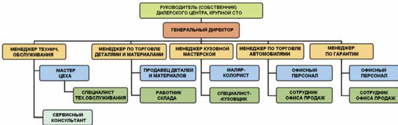
Рисунок 2-10: Типовая организационная структура дилерского центра

Хотя поначалу может показаться, что иметь собственную авторемонтную мастерскую очень выгодно, хороший специалист может часто зарабатывать гораздо больше денег и иметь меньшую головную боль, просто работая на кого-то другого.