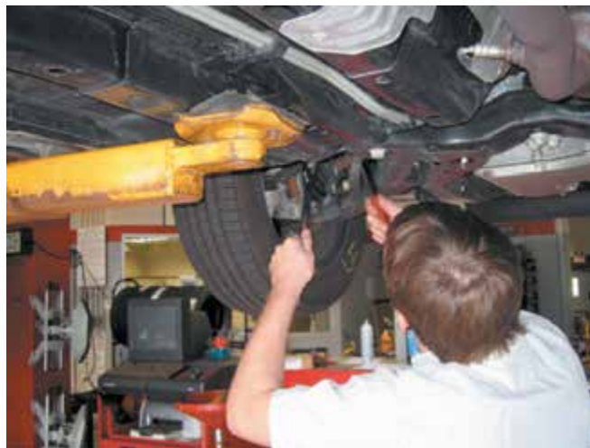
Рисунок 2-1: Специалист дилерского центра должен проверить функционирование всех узлов и агрегатов автомобиля по шумности их работы и наличия чрезмерных перемещений; источник: Pearson Education, Inc.

транспорт, питание, и проживание. Нередко дилеры предлагают онлайн обучение специалистов на дому, предполагая минимальный заочный контроль процесса освоения знаний.