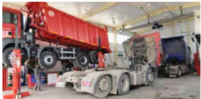
Рисунок 2-5: Типичным представителем сервисного подразделения является собственный цех по техническому обслуживанию и ремонту автомобилей грузового автотранспортного предприятия; источник: agroru.com