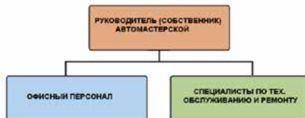
Рисунок 2-11: Простейшая организационная структура автомастерской

Организационная структура независимой станции технического обслуживания может иметь многоуровневую структуру, подобную структуре управления дилерским центром, но может иметь и простейшую структуру управления, представленную на рисунке 2-11.