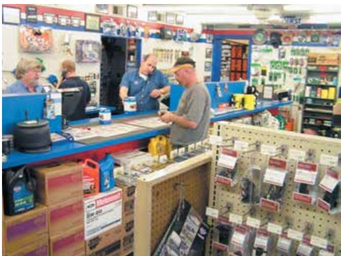
Рисунок 2-9: Продавцу-консультанту необходимы хорошие знания технологии ремонта, чтобы оказывать эффективную помощь клиенту