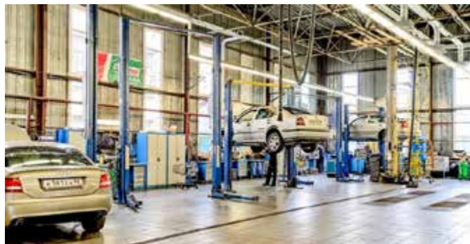
Рисунок 2-2: Типичный независимый сервисный центр. Независимые центры занимаются обслуживанием самых разнообразных транспортных средств, и выполняют множество различных операций по ремонту и обслуживанию. Некоторые независимые автосервисы специализируются только в одной или двух сферах обслуживания, или работают только с одной или двумя марками автомобилей; источник: Дилижанс С-Пб